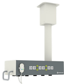
Infällbart Hammar huvud/concept