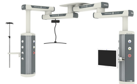
Tandem, med lyft-brygga